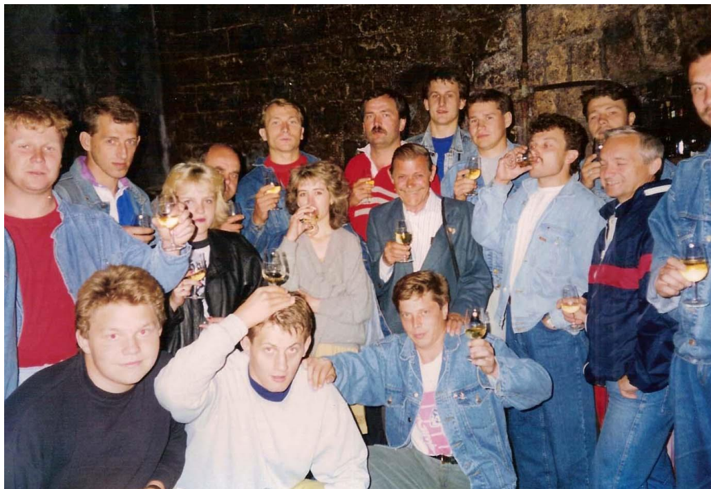
Francuskie winnice i radosna degustacja...